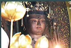
金剛定寺十一面観音座像