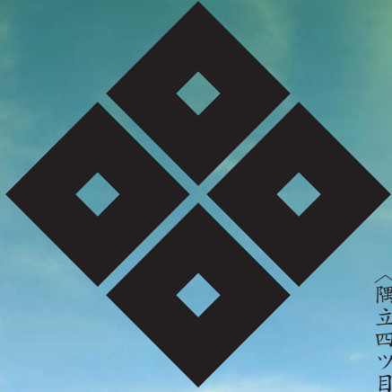
六角氏 〈隅立四ツ目〉