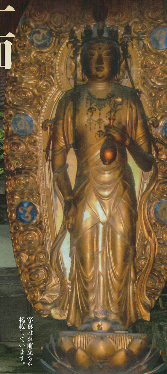
写真はお前立ちを 掲載しています。