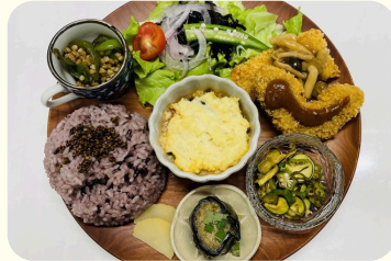
雑穀と旬の野菜で美味しいを体験 して細胞スイッチをONにしよう