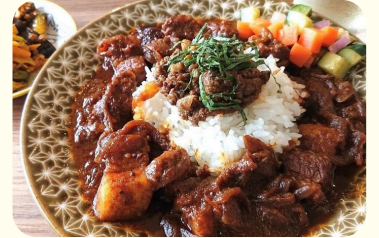
親子で作る♪ 簡単じぶん家のスパイスカレー