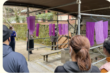
いにしへの高貴な色ムラサキを 染めてみませんか？