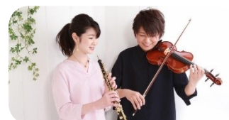
音楽と日本庭園の融合 - 参加型コンサート -