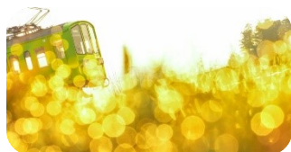
身近にある絶景を探して ~私の人生を変えたカメラと SNS~