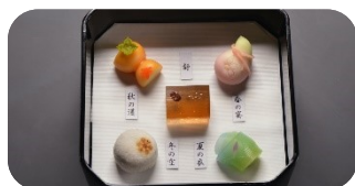
和菓子作り体験& 美味しい政所茶の入れ方講座