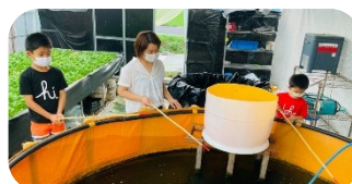
幻の湖魚“ホンモロコ”を 自分で釣って焼いて食べよう!