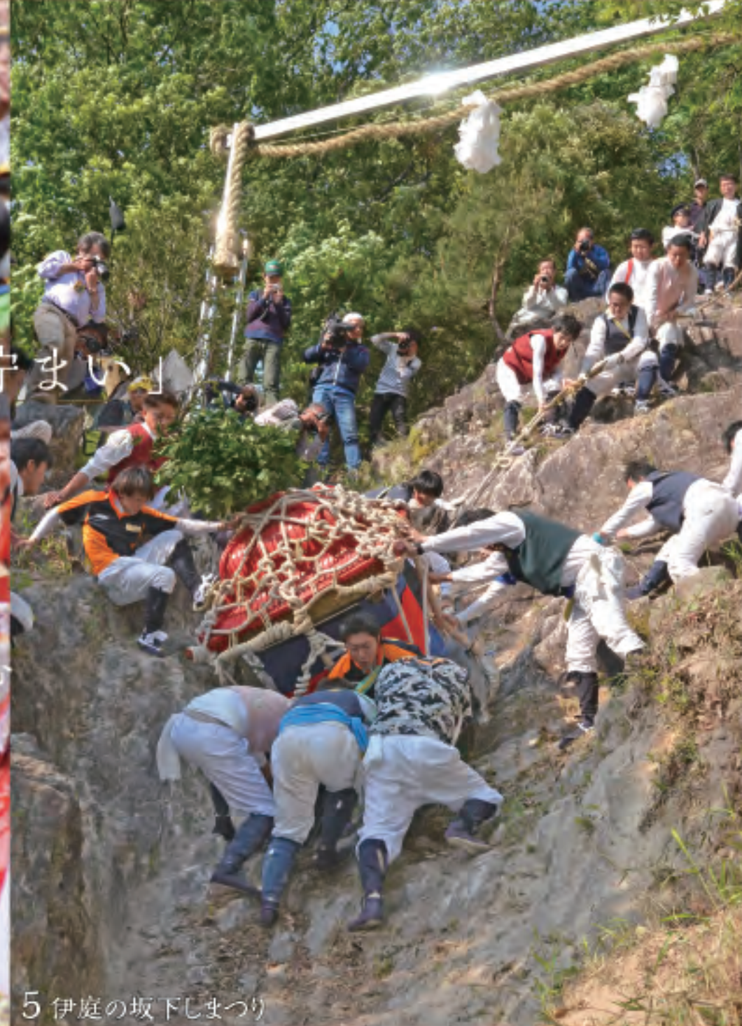
5 伊庭の坂下まつり