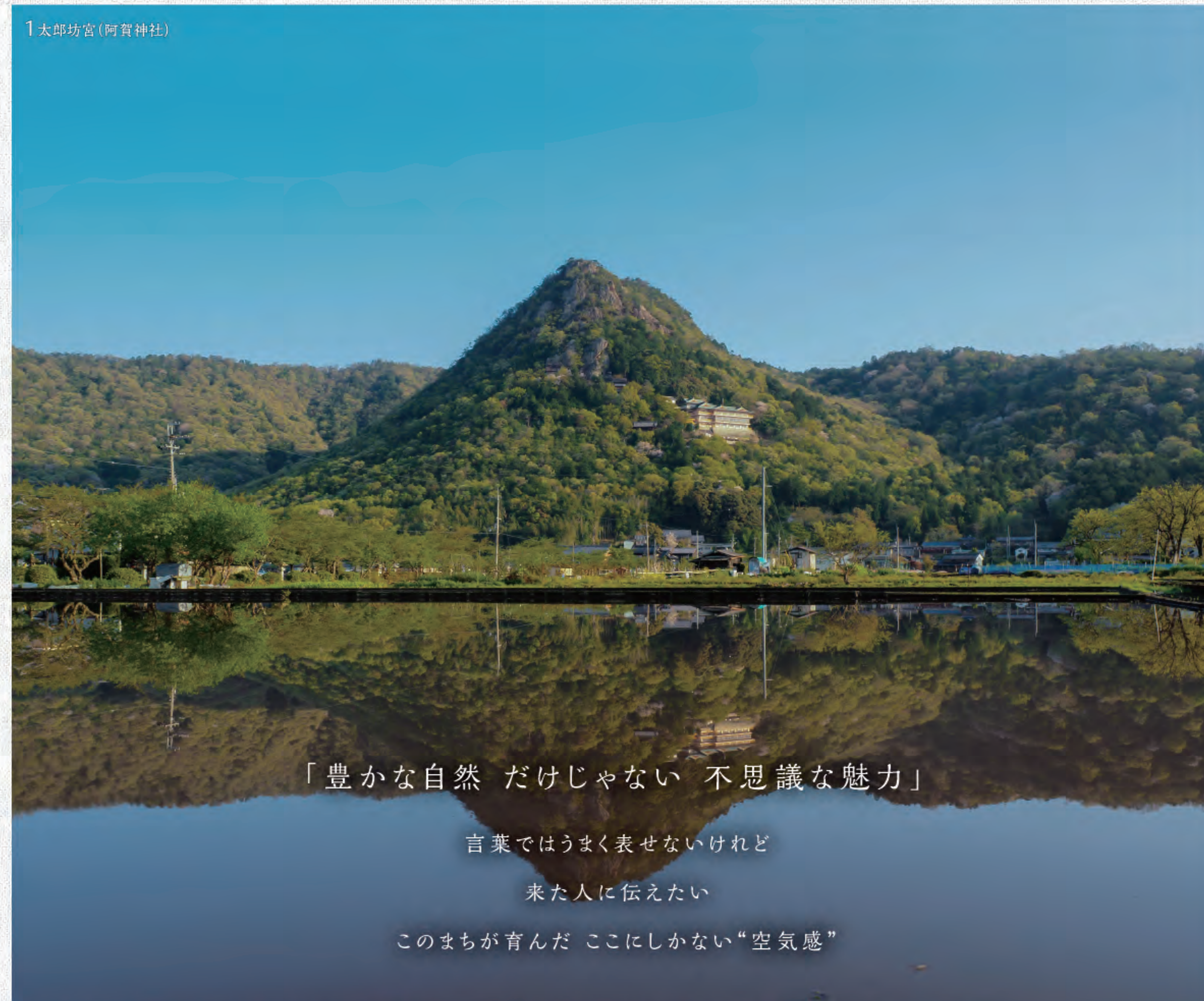
1 太郎坊宮(阿賀神社)