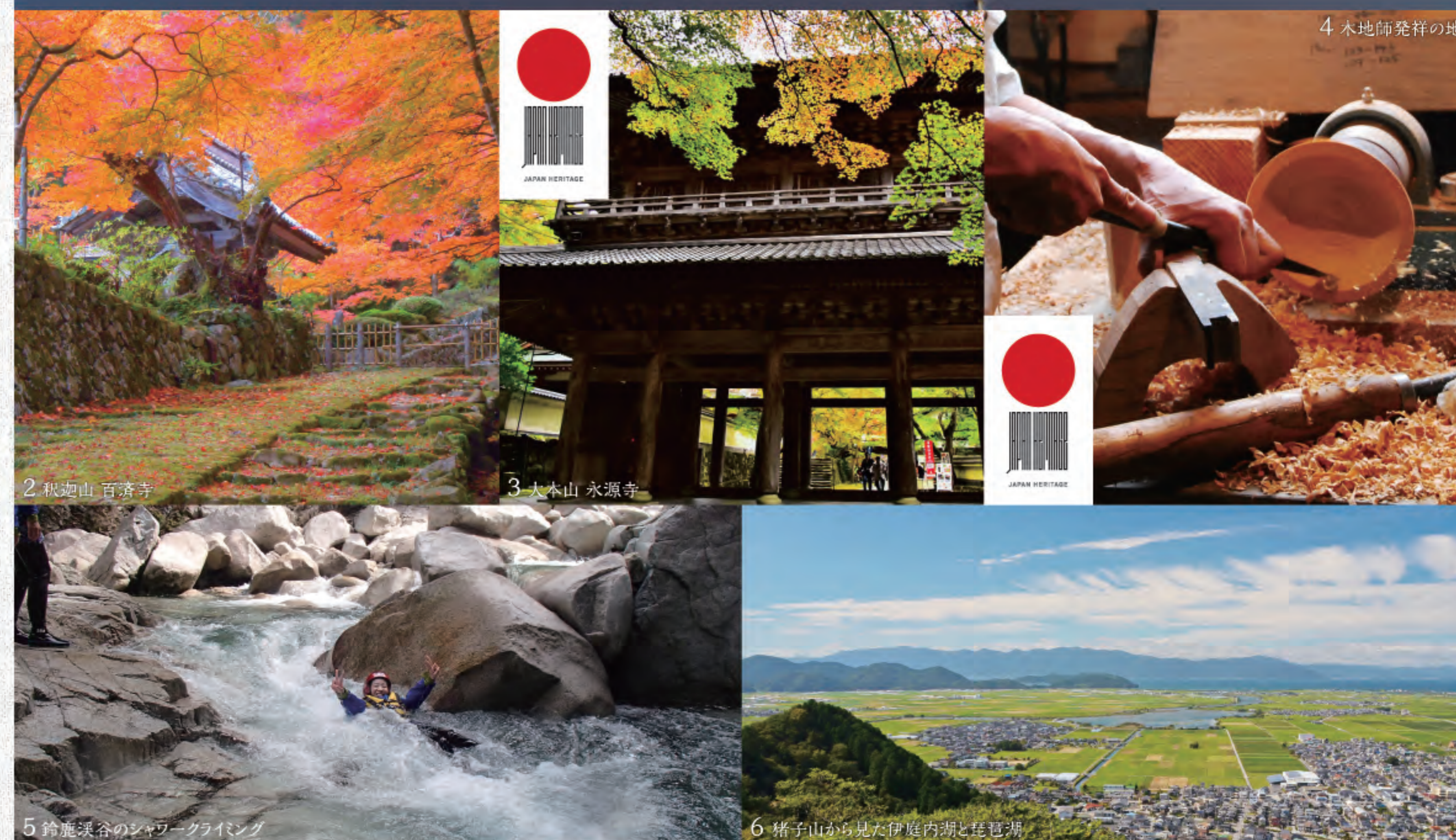
2 釈迦山 百濟寺

言葉ではうまく表せないけれど 来た人に伝えたい このまちが育んだ ここにしかない“空気感”