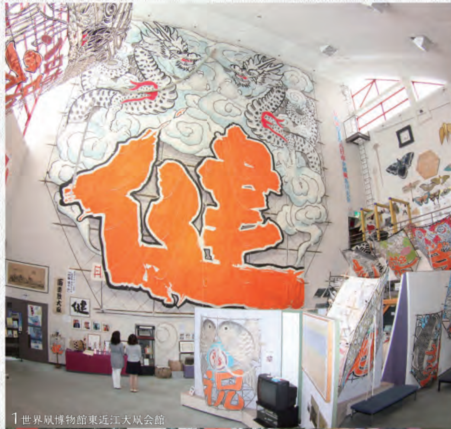
1 世界風博物館東近江大鳳会館