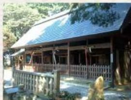
国重文 布施神社本殿

普段何気なくその前を通り過ぎている身近な神社仏閣、実はその本殿やご本尊が国指定の重要文化財だった。滋賀県ではこんなことが珍しくありません。改めて身近にある豊かな歴史的環境を実感していただけます。