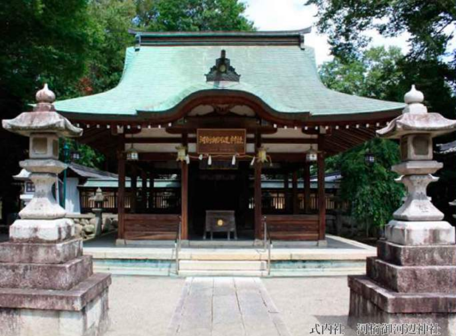
式内社 河桁御河辺神社

「五穀豊穰」と「村中安全」 いつの世も変わりのないこの願いを 一千数百年余受け止め続けた村々の神々