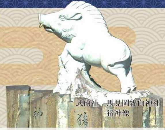
式内社 馬見岡綿向神社 猪神像