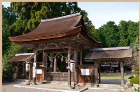
国重文 押立神社櫓門