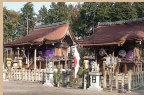
国重文 高木神社本殿 境内社 日吉神社本殿