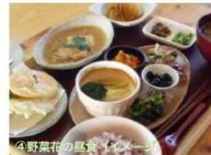
4野菜花の昼食 (イメージ)