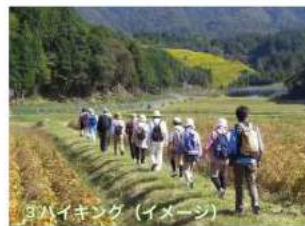
3ハイキング (イメージ)