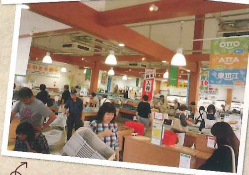
あいとうマーガレットステーション直売所